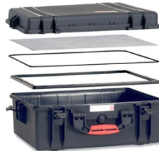
[ HPRCPF-005-01 ]

[ México D.F ] 55.8851.8726 - 55.8851.8725 [ Querétaro ] 442.234.1610 - 442.234.1338 www.harderback.com