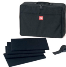
[ HPRCBAG2460-01 ]